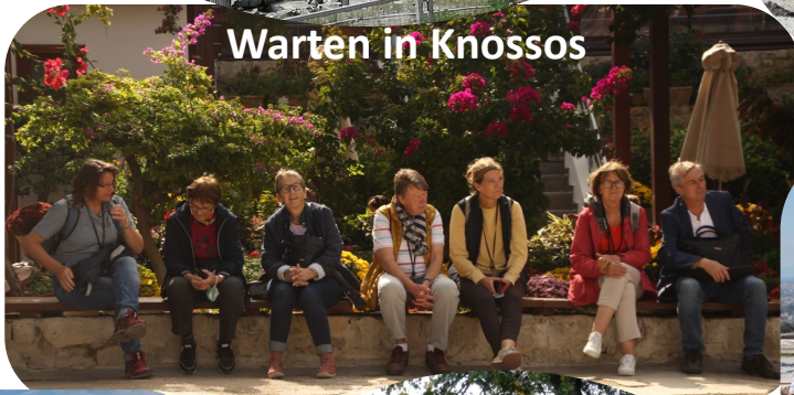
Warten in Knossos