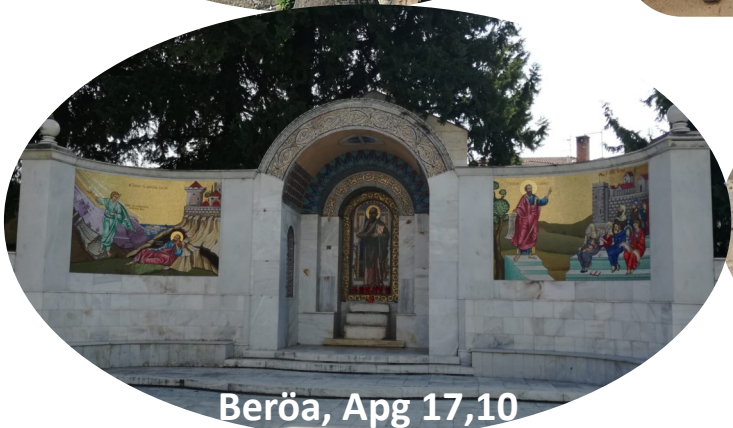
Beröa, Apg 17,10