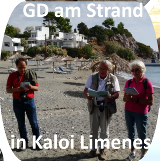
GD am Strand in Kaloi Limenes