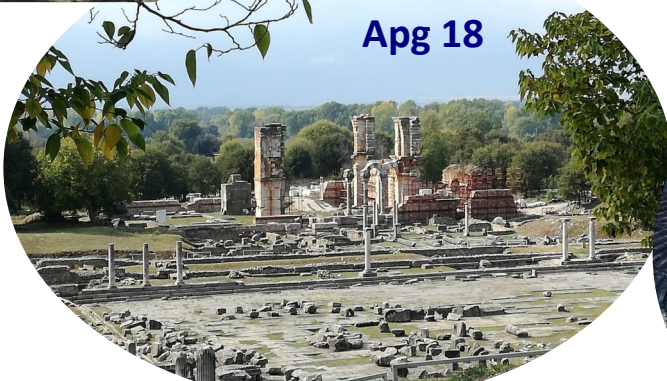
Korinth Apg 18