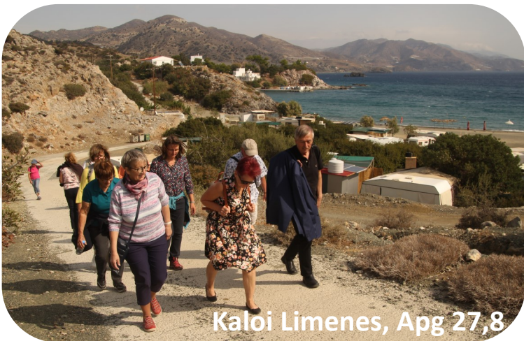
Kaloi Limenes, Apg 27,8