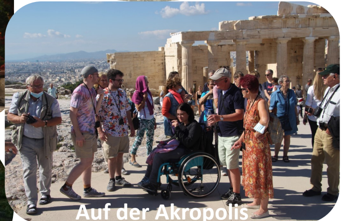
Auf der Akropolis