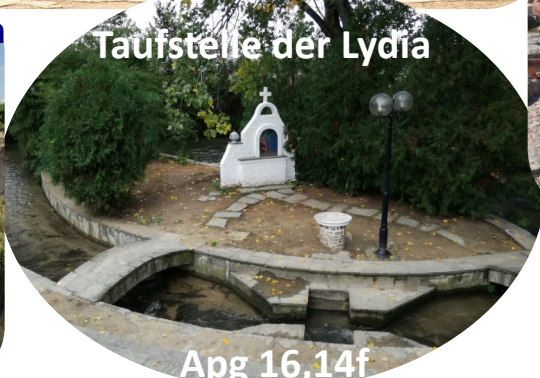
Taufstelle der Lydia