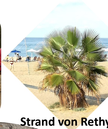
Strand von Rethymno