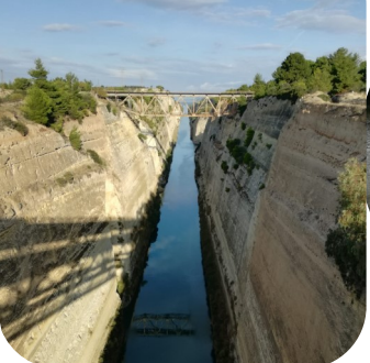
Isthmus von Korinth