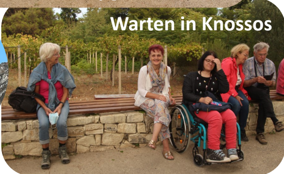
Warten in Knossos