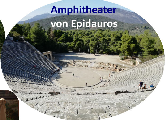
Amphitheater von Epidauros