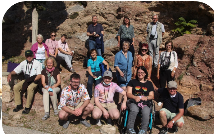
Am Areopag in Athen, Apg 17, 22ff