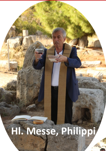
Hl. Messe, Philippi