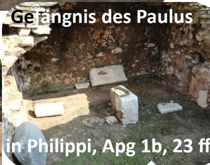
Gefängnis des Paulus in Philippi, Apg 1b, 23 ff