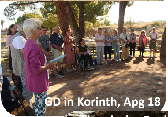
GD in Korinth, Apg 18