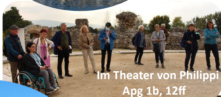
Im Theater von Philippi Apg 1b, 12ff