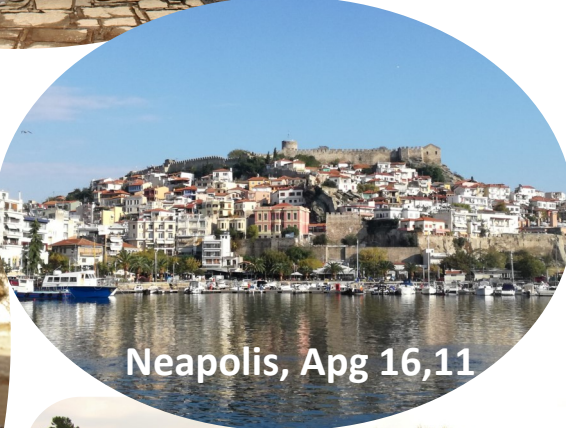
Neapolis, Apg 16,11