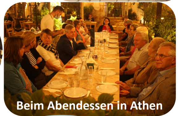
Beim Abendessen in Athen